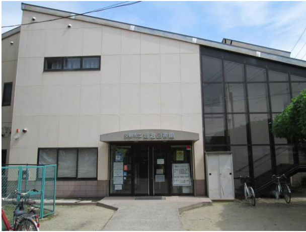
交野市立倉治図書館